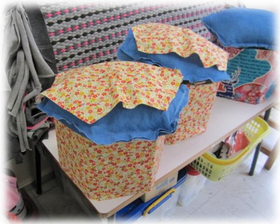
スツールの作製途中です