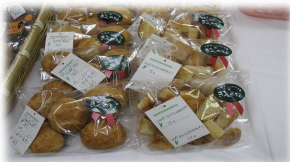
スコーン 160円・ラスク 150円 (はばたき・福島市)