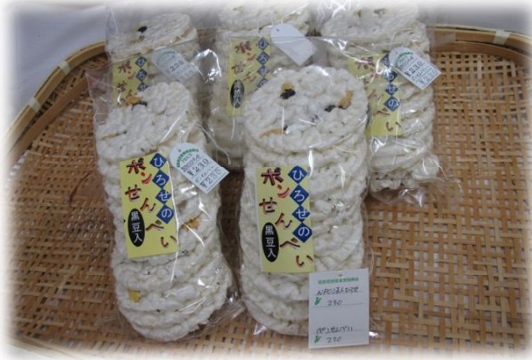
ポンせんべい230円 (ひろせ・伊達市)