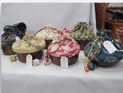
一閑張り・きんちゃく 1,500円, 1,800円 (ふぁみりかん・絆・郡山市)