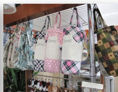
ペットボトル入 500円、700円 (太陽学園・福島市)

■ お店のご案内 名称: 福島県障がい者施設製品・サービス販売店 愛称: チャレンジショップふくふく 営業時間: 午前10時~午後6時 定休日: なし 住所: 福島市栄町5番1号 電話: 024-573-6233 FAX: 024-573-6234