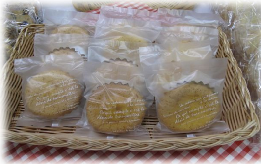
マドレーヌ 80円 (ろんど・福島市)