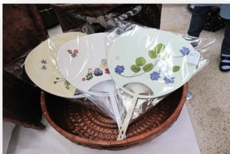
うちわ 350円(なのはなの家・福島市) うちわ 250円 (生きる・福島市)