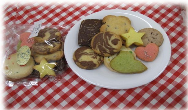
ミックスクッキー 250円 (太陽学園・福島市)