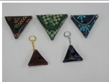
・三角小銭入れ 600円 ・三角小銭入キーホルダー 500円