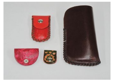
・印鑑ケース 500円・カネケース 1,200円 ・コードバンド (大)200円 (小)100円 (でんでんむし)