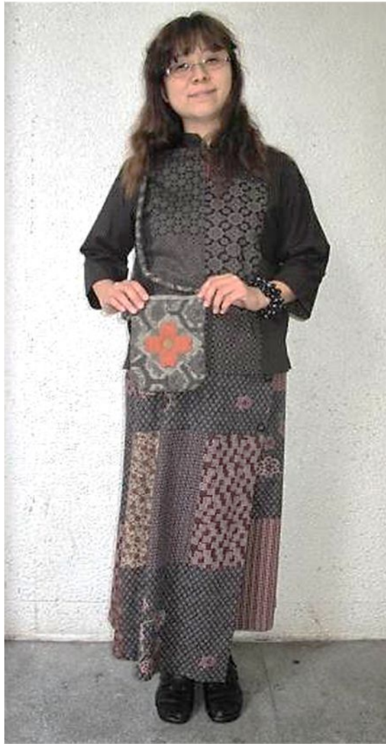
・ブラウス 2,000円・スカート 2,000円・ポシェット 1,000円 (工房トマトハウス)

■9月27日(火)まで ■出展 トマトハウス(郡山市) ワークセンター歩(福島市) でんでんむし(三春町)