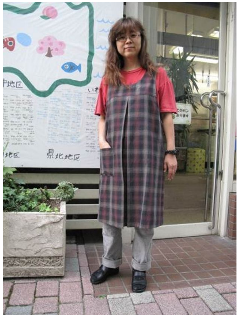
エプロン 2,000円 (工房トマトハウス)