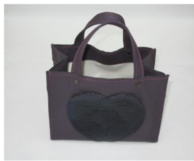
バッグ (紫) 3,900円 (ワークセンター歩)