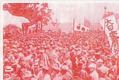
▲1920年5月2日第1回メーデー(東京上野公園)