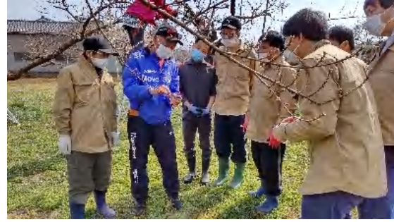
桃の摘蕾作業（支援員2名、利用者5名）