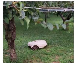
（ロボット型草刈り機）

乗用草刈り機やロボット型（ルンバ）草刈り機、刈払い機の他に畝間に大麦を植え雑草が生えないようにしている農家さんもいます。この大麦は自然に枯れるので放置し肥しにします。