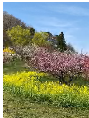
飯坂温泉「花もの里」

今年度も、研修会は収容人数の半分に定員を設定するなどの感染防止対策を講じながら、事業所の商品開発やディスプレイなど、今後の販売の役に立つ研修会を計画しますので、その際は是非ご参加下さいますようお願いいたします。